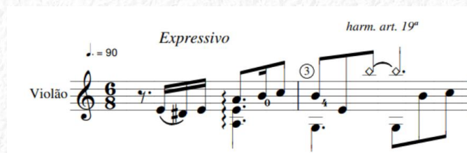
Figura 2 – Gita (Compasso 1)