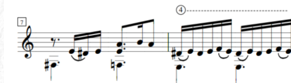
Figura 3 – Gita (Compasso 7 e 8)