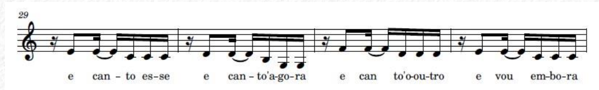
Figura 1 – “E canto esse” – Melodia “maior”

desacompanhada ( a capella ) e inicia os cocos e cirandas na palestra com a frase “só sei que peguei cantar...” e termina com “vocês gostaram?”. Gostaria de trazer dois exemplos (Figuras 1 e 2) transcritos dessa ocasião, que evidenciam sua capacidade melódica variacional em pequenas estrofes iguais em letra, mas com resultados melódicos apartados: