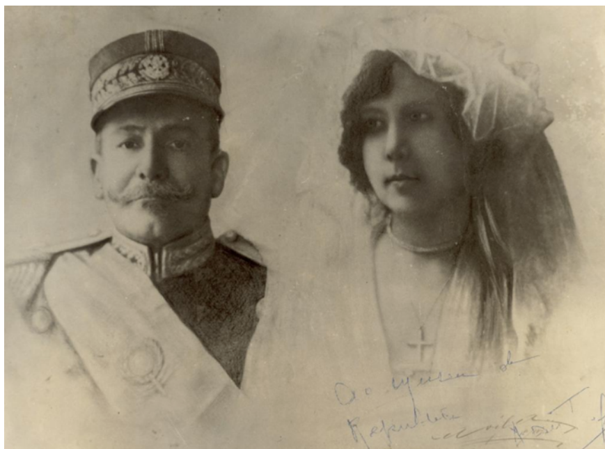
Brasileira fotográfica, dezembro de 1913