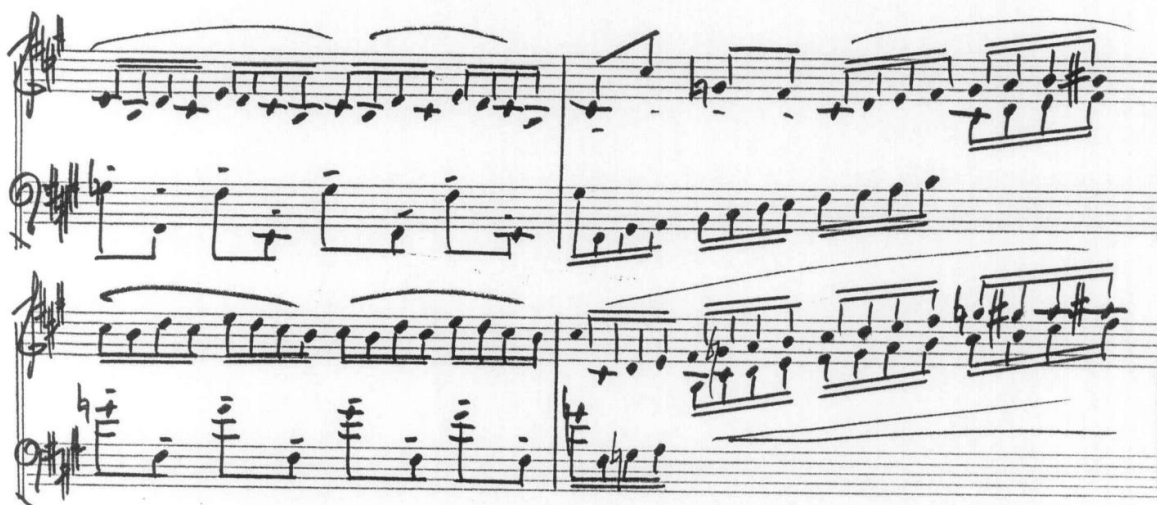
Figura 7. Contraste articulação legato (m.d) e portato (m.e).

O terceiro movimento traz um caráter mais leve, vivo e repetitivo, em forma rondó livre, e explora contrastes de articulação em legato, portato e staccati (Figura 7 e 8).