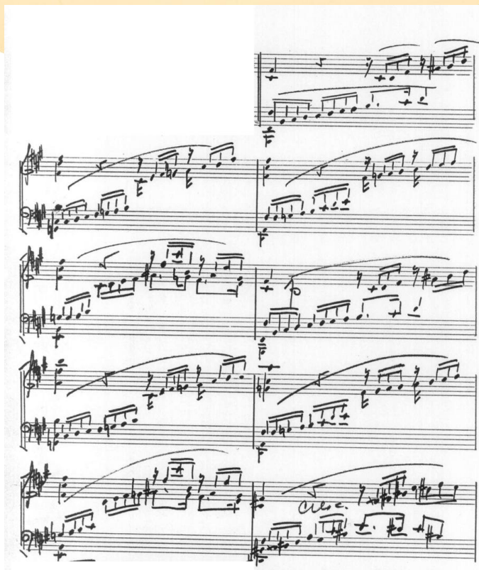
Figura 4. Seção mais expansiva de característica melódica escalar, frases de 4-5 compassos e saltos nas duas mãos.

No segundo movimento , de caráter muito lírico e sentimental, a compositora pede uma ambientação serena e uma sonoridade "quase em surdina". A experimentação cantado diversos tipos de fraseados foi determinante para alcançar o caráter sereno e conduzir as frases com um único apoio métrico por compasso resultando numa delimitação fraseológica de na seção A de 8+11+7 (Figura 5).