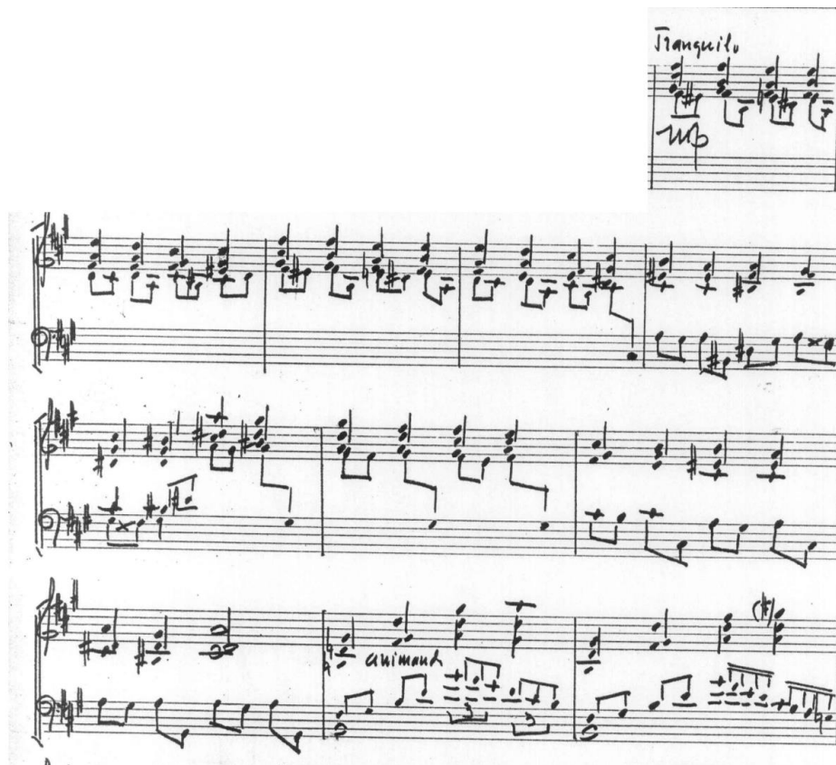
Figura 3. Seção "contemplativa": pequenos gestos e mudanças harmônicas de função colorística e fraseado de 2 a 3 compassos.

cromáticas dos acordes e definição clara de fraseado curtos de 2+2+1 ½ +3+2 compassos (Figura 3).