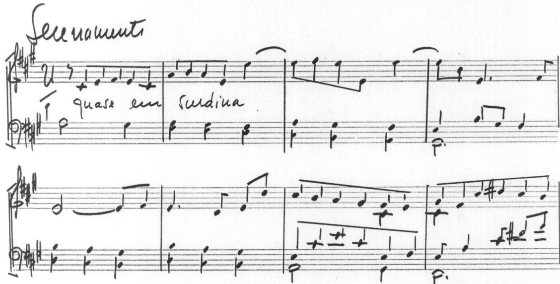
Figura 5. Seção A mais lírica e contrapontística.

A seção B é caracterizada por uma escrita estilo "aboio", de natureza melódica declamatória em oitavas paralelas, sempre intercalado pelo mesmo acorde na região médio-grave. A temporalidade entre o acorde e as oitavas foi definida tendo em consideração diferentes tipos de agrupamentos das frases em oitavas, sempre pontuadas por breves cortes no pedal de sustentação, contrastes de dinâmica, e uma cesura maior dividindo a seção em duas partes.