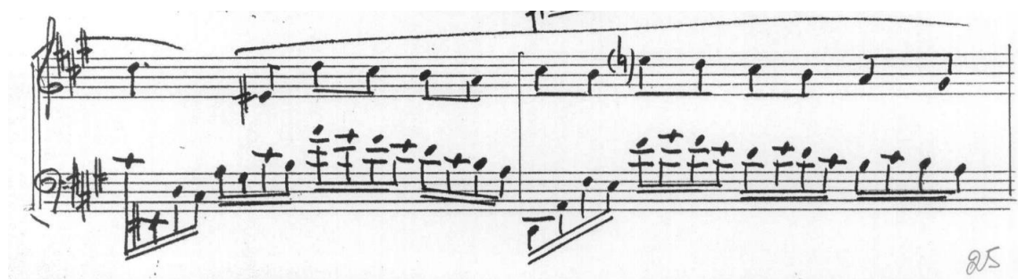
Figura 2. Trecho mais lírico e de ataque de nota mais lento.

A seção mais "contemplativa", como movimentação melódica de poucos saltos, demandou pedalização abundante, com riqueza de harmônicos, atenção auditiva às pequenas mudanças