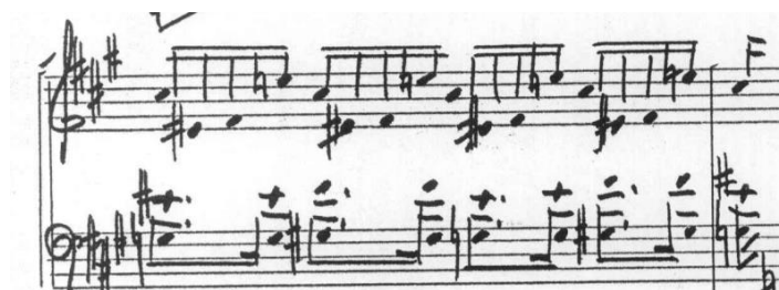
Figura 1. Trechos de caráter rítmico e mais "jocoso".

No primeiro movimento , decisões sobre timbre mais claro, com ataques de nota mais incisivos e pedalização esparsa e superficial nas partes mais rítmicas (Figura 1), contrastavam com timbre mais cheio, ataques mais lentos e pedalização farta e profunda, ressaltando os harmônicos das notas graves nos trechos mais líricos (Figura 2).