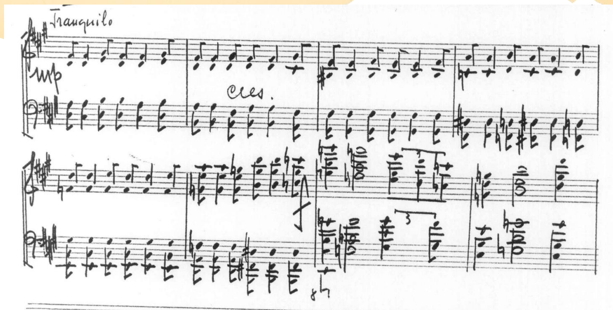
Figura 9. Seção contrastante do 3o. movimento: textura homofônica e intervalo de 10as. na mão esquerda.

Essa comunicação é a apresentação da performance resultante das investigações do Laboratório de Pesquisa XXXX (Universidade...) sobre compositoras brasileiras para piano e música de câmara.