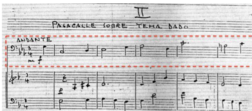
Ejemplo 9: Tema en bajo continuo ostinato realizado por el contrabajo en el registro grave del instrumento. Manuscrito de la Sonata Antigua para contrabajo y piano de Fabio González Zuleta. Pasacalle sobre tema dado segundo movimiento (c.1-5).

El segundo movimiento de esta obra, es un pasacaglia o pasacalle como lo escribe el propio compositor en la partitura. La utilización del contrabajo en este movimiento, es de exclusivo acompañamiento, ejecutando un bajo continuo ostinato que se repite cada 8 compases, donde el bajo continuo que va desde la región grave hasta la región aguda del contrabajo, repitiendo este motivo todo el tiempo, acompañando los diversos temas con variaciones que realiza el piano. (Ejemplo 9 y 10).