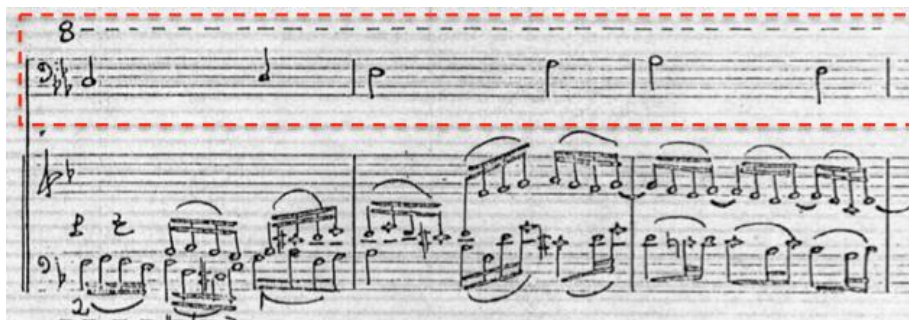
Ejemplo 10: Tema en bajo continuo ostinato realizado por el contrabajo. El compositor escribe una indicación de octava arriba, para ejecutar las notas en el registro medio-agudo. Manuscrito de la Sonata Antigua para contrabajo y piano de Fabio González Zuleta. Pasacalle sobre tema dado segundo movimiento (c.41-43)