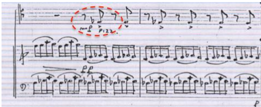
Ejemplo 8: Utilización del pizzicato en el registro grave del contrabajo. Manuscrito de la Sonata Antigua para contrabajo y piano de Fabio González Zuleta. Allegreto, primer movimiento (c.117-118).

El compositor recurre a la técnica en pizzicato en pocas oportunidades de la obra. Cuando lo hace, generalmente son elementos de acompañamiento con destaque en el timbre del sonido en pizzicato, reforzando la función tonal (Ejemplo 8).