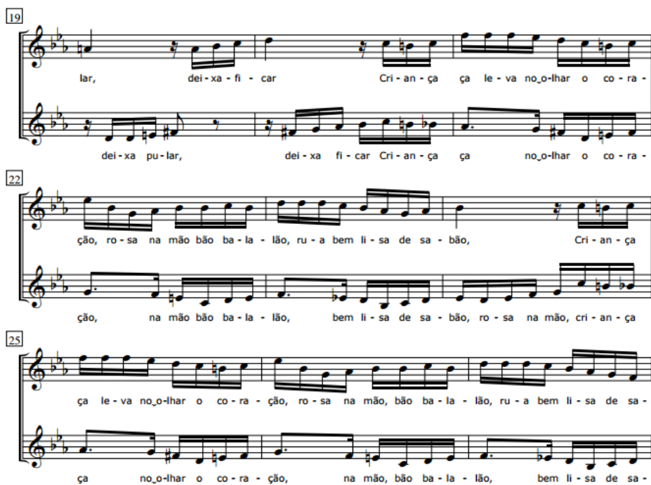
Exemplo 2: trecho de “Rimas infantis” (1979), compassos 19-27. Edição FUNARTE.

Este trecho demonstra a extensão apresentada na peça, compreendida entre Si bemol 2 e Fa 4 , que queremos enfatizar aqui. Mas ao trazermos este exemplo, é importante observar seu nível de complexidade, em se tratando de coros infantojuvenis. A peça apresenta constantes modulações, cromatismos, variedade rítmica entre as vozes e um texto que precisa ser bem articulado. Tudo isso demanda certa experiência do coro, no que diz respeito ao desenvolvimento da técnica vocal e também no que tange à leitura musical, pois uma peça com tais características dificilmente seria ensinada por imitação. Podemos considerar que esse procedimento – o ensino por imitação – é o mais comumente empregado, atualmente, por muitos regentes de coros infantojuvenis em nosso país. Podemos reiterar, ainda, que é pela prática da imitação que as crianças geralmente aprendem a cantar, de maneira informal e intuitiva, as canções que ouvem e vivenciam em suas rotinas diárias.