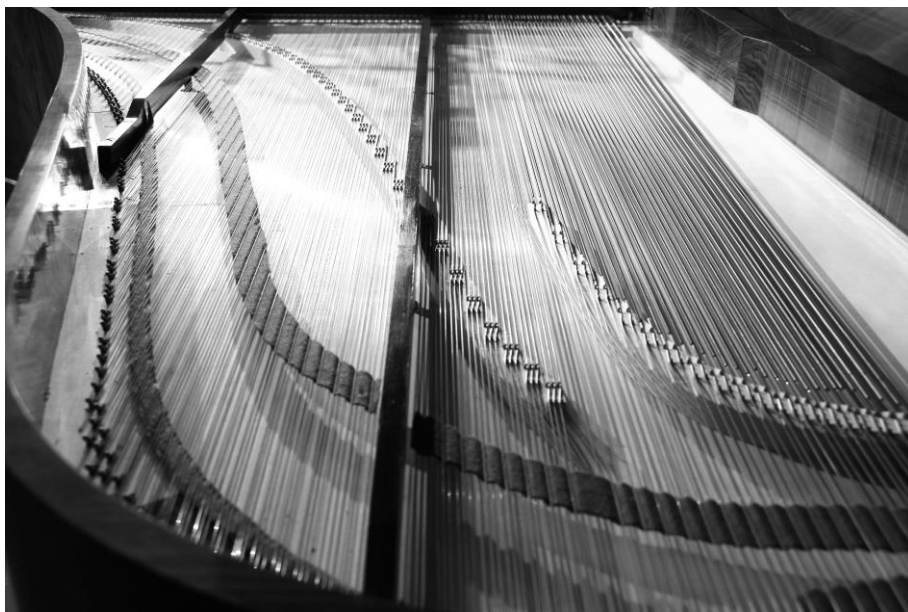
Fig. 4: Visão traseira do encordoamento paralelo suportado pela estrutura de madeira em uma réplica de um piano J. B. Streicher feita por Paul McNulty em 2014. 11