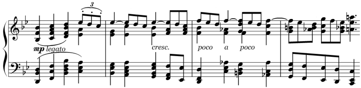
Ex. 6: Brahms, Concerto nº 2 para piano e orquestra Op. 83 , primeiro movimento, c. 73 – 76. Melodia em acordes.

a devida ênfase à linha melódica principal, produzindo assim a textura sonora densa que é característica inequívoca da obra brahmsiana.