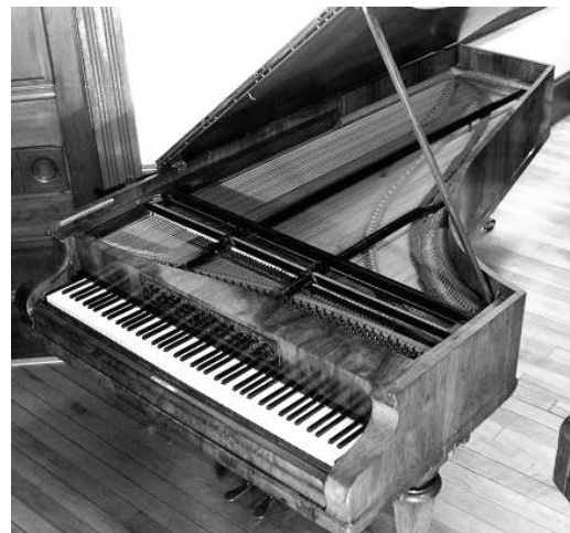
Fig. 3: Visão do encordoamento paralelo em um Piano J. B. Streicher (Frederick Historic Piano Collection) 10