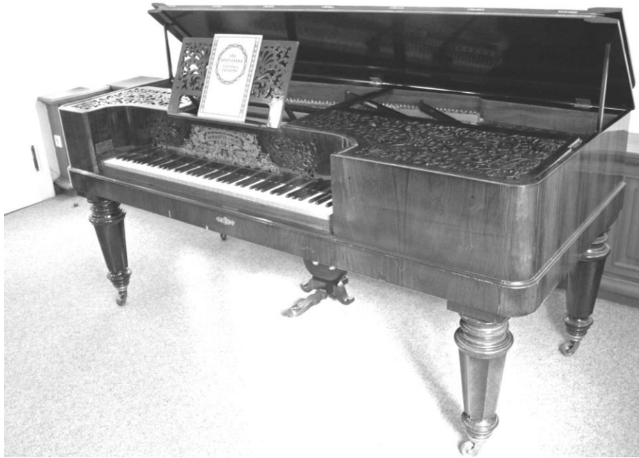
Fig. 1: Piano Baumgarten & Heins , utilizado por Brahms nos anos 1861 e 1862, atualmente na coleção do Museu Brahms em Hamburgo 5 .

Heins & Baumgarten , que eu havia mencionado, infelizmente não dispõe de pianos de concerto, porém mais uma vez me encantei com o maravilhoso som de seu modelo horizontal, sinto que nunca ouvi antes um som tão cantabile (AVINS, 1997: 65) 4