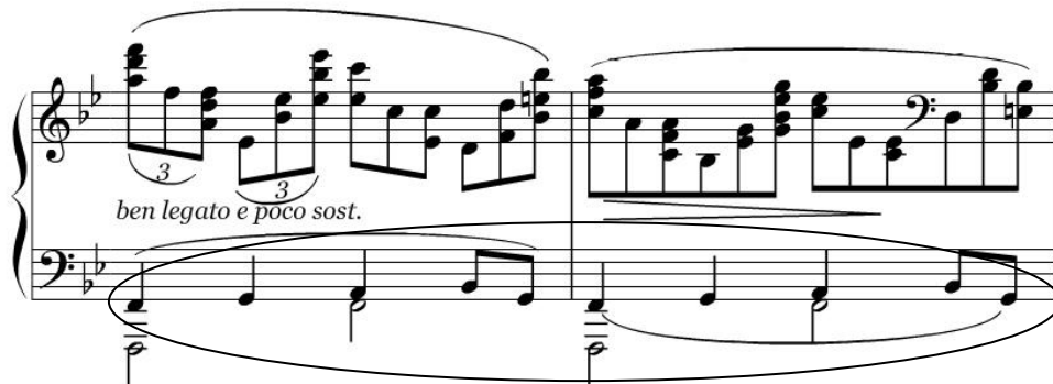
Ex. 5: Brahms, Concerto n° 2 para piano e orquestra Op. 83 , primeiro movimento, c. 23 – 24.

Enquanto Brahms preferia tocar seus concertos em pianos mais ‘poderosos’, trechos contendo a escrita musical com as mesmas particularidades tímbricas de seu Streicher descritas mais acima são encontrados também em seus Concertos para piano e orquestra , como pode ser visto abaixo (Ex. 5), através da voz que cita o tema da obra no registro médio grave.