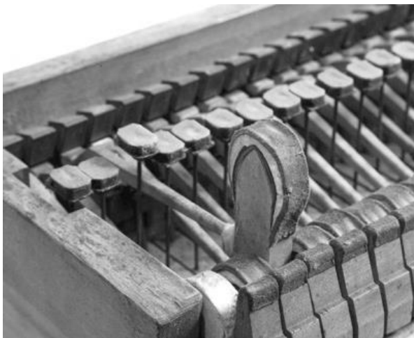
Fig. 2: Martelos revestidos por couro em um piano Ignaz Bösendorfer de 1847

eram elogiados por Beethoven e os feitos por seu avô, Johann Andreas Stein, estavam entre os preferidos de Mozart. Dentre os construtores vienenses, Streicher era o mais inovador, oferecendo instrumentos com a usual mecânica vienense, com a mecânica inglesa e até tendo patenteado um sistema híbrido, unindo particularidades entre essas duas tecnologias em 1831. O Streicher de Brahms havia sido construído em 1868 e levava o número de série 6713 9 . Esse instrumento, que acompanhou o compositor até sua morte em 1897, possuía a mecânica vienense de escape único, os martelos revestidos por couro (Fig. 2) e o encordoamento paralelo (Fig. 3) era suportado por uma estrutura de madeira (Fig. 4).