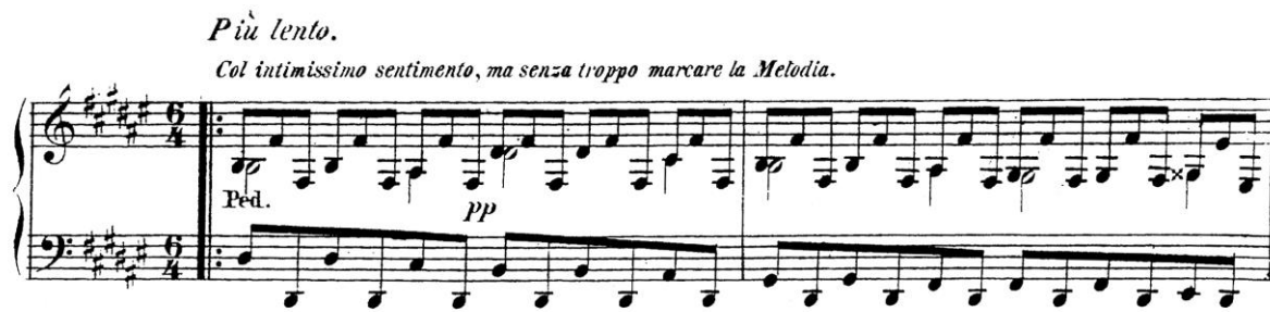
Ex. 4: Brahms, Balada Op. 10 n.º 4 , c. 47 e 48. Edição Breitkopf & Haertel, 1856.

melódica pungente permaneça um espectro translúcido, emanando debilmente por trás do delicado véu sonoro do acompanhamento” (ARNONE, 2006: 8). 14