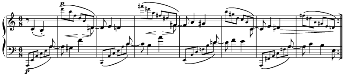
Ex. 3: Brahms, Capriccio Op. 116 n° 7 , c. 21 – 28.

Um exemplo que claramente ilustra a priorização da linha melódica escrita nesse registro é o encontrado em seu Capriccio Op. 116 n° 7 (1892), onde a melodia se encontra no registro médio e o acompanhamento em arpejos se alterna nos outros registros: