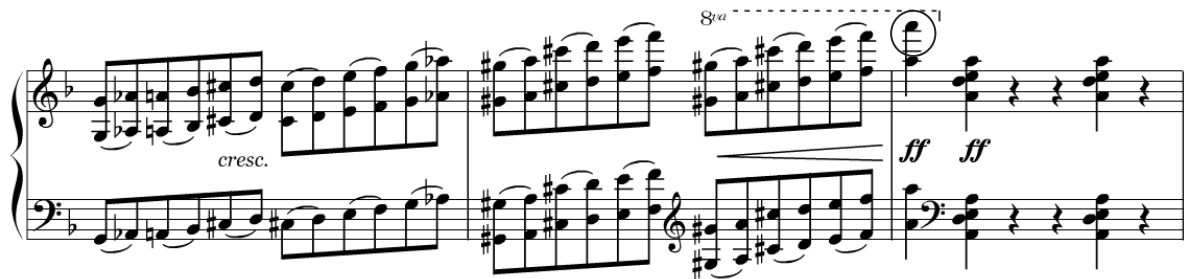
Ex. 2: Brahms, Concerto n° 1 para piano e orquestra Op. 15 , primeiro movimento, c. 304 – 306. Trecho contendo a nota lá 7 , no compasso 306.

Segundo Bozarth e Brady (1990: 53), Brahms teria composto nesse Graf as Variações sobre um tema de Händel op. 24 , os Quartetos para piano Op. 25 e Op. 26 , o Quinteto para piano Op. 34 , parte da Sonata Op. 38 para violoncelo e piano além de muitas das canções do ciclo Die Schöne Magelone Op. 33 .