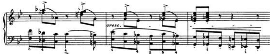
Ex. 5: CHOPIN, F. Prelúdio op. 28 n. 22 , c. 14 a 16. Cortot (ed.). Paris: Editions Salabert, 1926. Indicação de cresc. seguida de linha tracejada nos c.15 - 16, sobrepondo-se a chave de crescendo no c. 16.