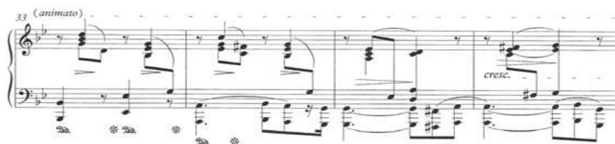
Ex. 1: CHOPIN, F. Prelúdio op.28 n.22 , c. 33 a 36. Eigeldinger (ed.). Frankfurt: Peters Urtext, 2003. Retorno do tema inicial no segundo tempo do c. 34

Em sua gravação, Cortot ilustra este conceito de maneira notável. Apesar de executar a obra em andamento rápido (metrônomo de aproximadamente \text{♩}=144 ) 2 , o pianista alarga o tempo em vários momentos (anacruse e c. 1.1 3 , c. 7.1, c. 8.1, c. 8.2, c. 24.2 e c. 25.1) e, sobretudo, no c. 34.2, no qual valoriza, com grande ênfase, o retorno do tema inicial em A’.