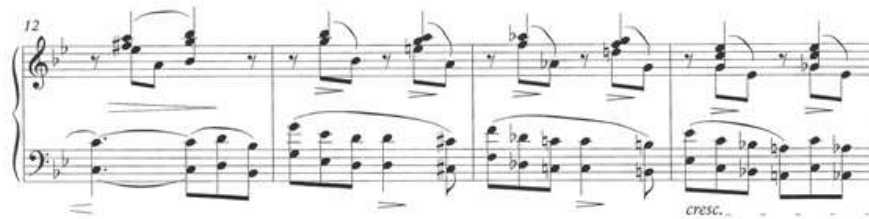
Ex3: CHOPIN, F. Prelúdio op. 28 n. 22 , c. 12 a 15. Eigeldinger (ed.). Frankfurt: Peters Urtext, 2003. Sinais expressivos na mão esquerda sob as notas Ré no c. 13 e Dó no c. 14.

Esse efeito não só contribui para uma oscilação no andamento que remete ao significado de agitato , como também destaca um aspecto importante da escrita Chopiniana: