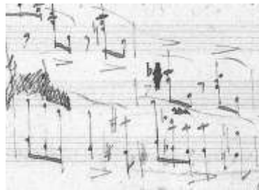
Ex. 4: CHOPIN, F. Prelúdio op. 28 n. 22 , c. 13 a 14. Manuscrito autógrafo. Varsóvia: Biblioteca Nacional, 1999. Acentos longos abaixo das notas Ré no c. 13 e Dó no c. 14 na mão esquerda assinalados.

É importante lembrar que muitos estudiosos e editores interpretam dois tipos de acentos na grafia de Chopin. Há os acentos longos que seriam graficamente pequenas chaves de diminuendo ( \text{—} ) e os acentos curtos que teriam a grafia normalmente encontrada para um acento (>). Deve-se mencionar que não há consenso para a interpretação da grafia do compositor a esse respeito. No manuscrito autógrafo, Chopin, aparentemente, utiliza o acento longo no trecho acima citado, conforme se vê no exemplo abaixo: