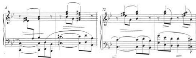
Ex. 2: CHOPIN, F. Prelúdio op. 28 n. 22 , c. 4-5, 12-13. Eigeldinger (ed.). Frankfurt: Peters Urtext, 2003. Intervalos extensos na mão esquerda: Si b - Dó # e Si b - Sol.

A interpretação do pianista Claudio Arrau também faz uso de flexibilidade agógica, porém de maneira distinta de Cortot. Arrau inicia o Prelúdio com tempo mais calmo, com caráter misterioso, inclusive com dinâmica equivalente a p (diferentemente do f indicado por Chopin), aumentando progressivamente a velocidade à medida que a frase se torna mais aguda, até alcançar seu ápice no c. 5, bem como distendendo o tempo ao final da mesma em seu movimento descendente, criando desta forma um outro tipo de agitação. Arrau, assim como Kissin, também realça pontos de maior expressividade, alargando o tempo quando o movimento melódico da mão esquerda inclui intervalos mais extensos: