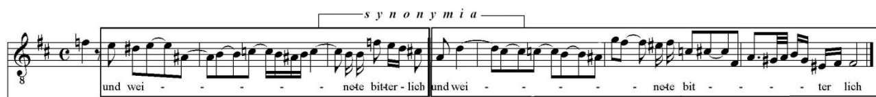
Figura 5: synonymia

Em nossa análise observamos ainda uma figura de repetição que, neste contexto, tem características do discurso verbal: a synonymia .