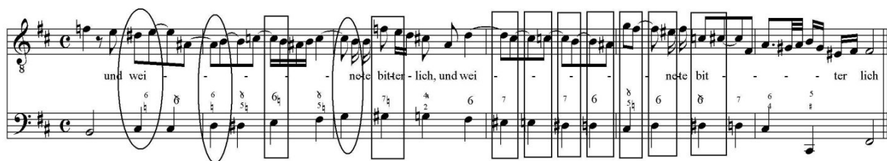
Figura 3: retardatio (○) e anticipatio (□)

As figuras que seguem, decorrentes da relação da melodia com as harmonias, apresentam um deslocamento com relação ao acorde sobre o qual se colocam, provocando uma dissonância. Encontramos duas situações distintas: no primeiro caso há a resolução tardia de uma dissonância em uma consonância, o que conhecemos hoje como “retardo” ( retardatio ); no segundo caso, semelhante à “suspensão”, o movimento melódico introduz antecipadamente uma nota que pertence ao acorde subsequente ( anticipatio ).