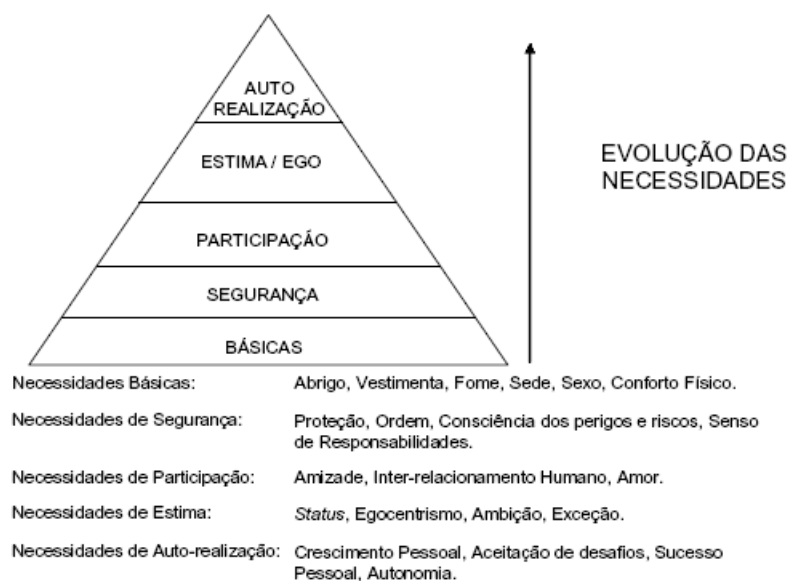
Figura 2 – A escala da “hierarquia das necessidades” de A. Maslow