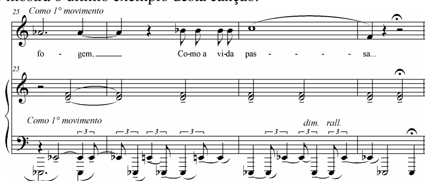
Ex. 7 - Retorno à representação da noite um tom acima do inicial. 11

Para terminar Villa-Lobos repete o vôo da mariposa transposto um tom acima, conforme verificado anteriormente, mantendo como plano de fundo a configuração sonora que sugere a noite e as badaladas do relógio, juntamente com o narrador até o final da canção, como mostra o último exemplo desta canção.